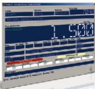
ViniGest Entrada de Uvas